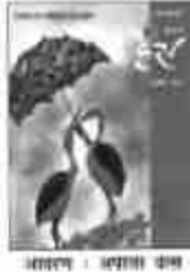
आवरण: अज्ञान का